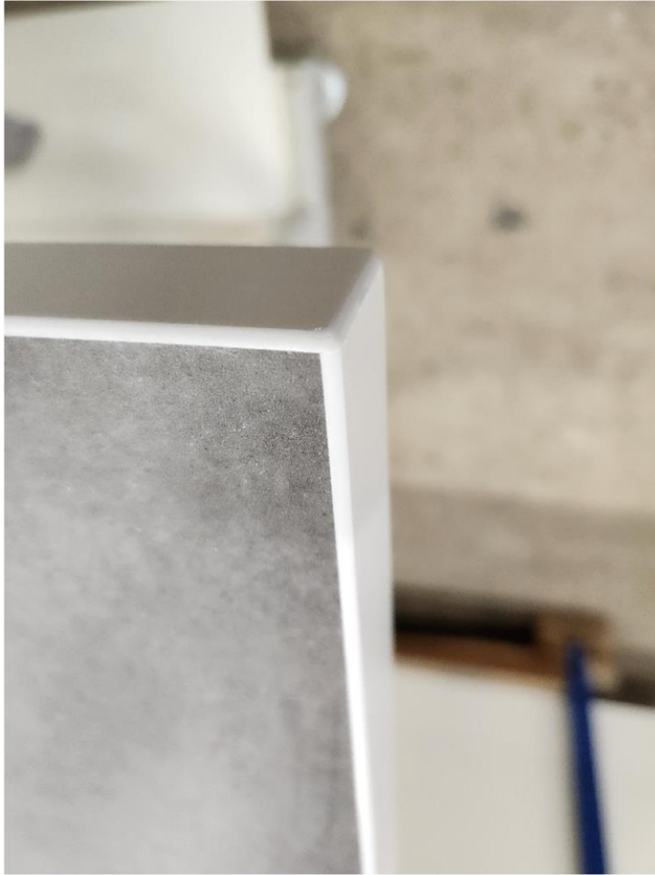
Abbildung 4 Platte in Beton Dekor mit 2 mm ABS Kante in RAL 7035