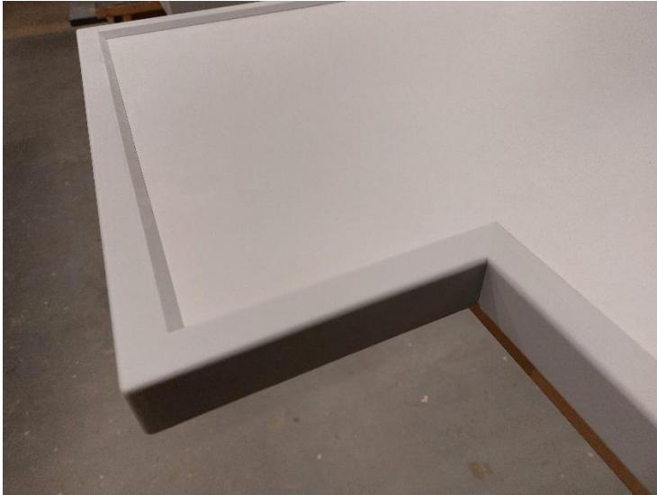
Abbildung 2 division ökodesk mit Kante in RAL 7035