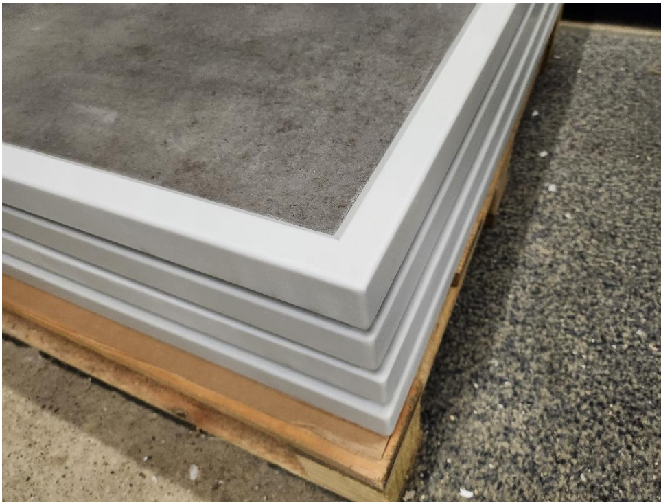
Abbildung 3 Platte in Beton Dekor mit Kante in RAL 7035